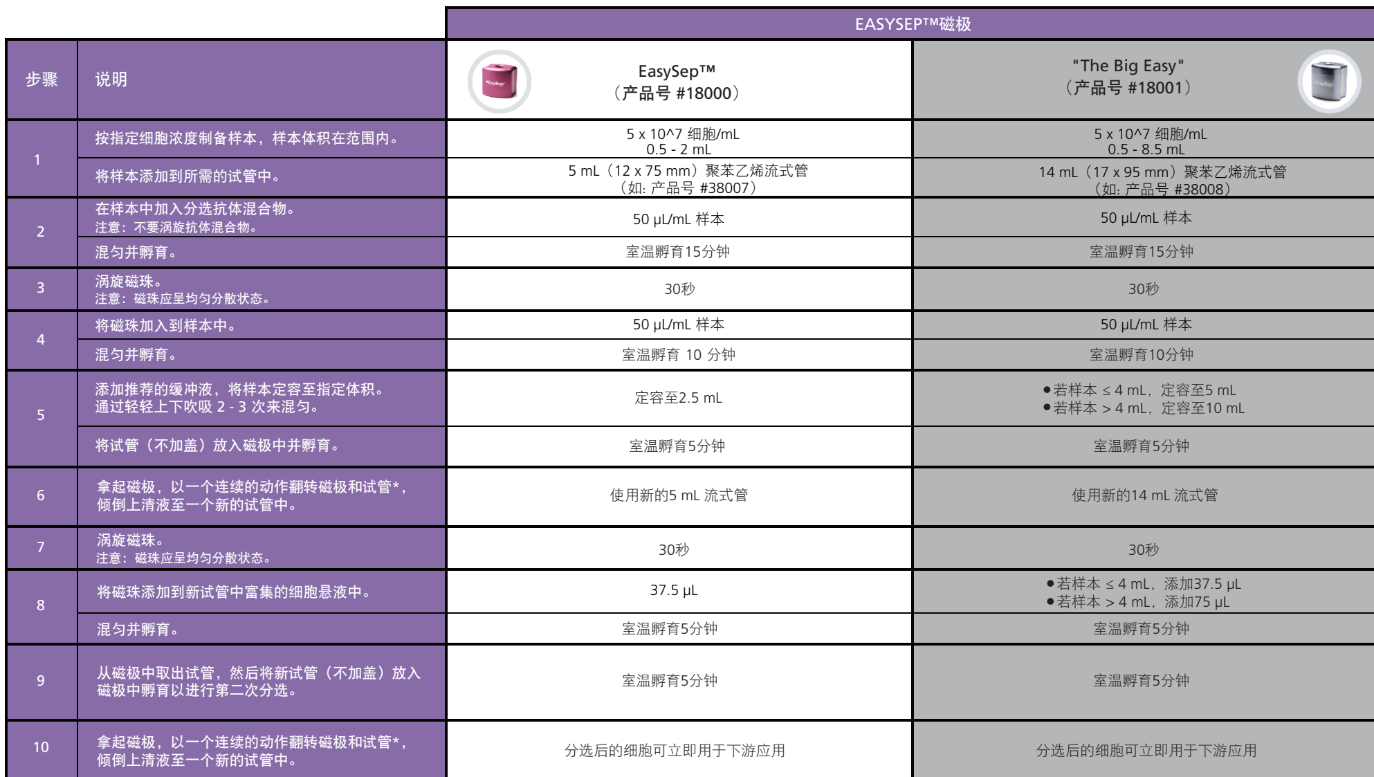
表1. EasySep™ 人Gamma/Delta T细胞分选试剂盒操作流程

请参阅第1页和第2页了解样本制备和推荐缓冲液。有关每种磁极的详细使用方法，请参阅表1和表2。