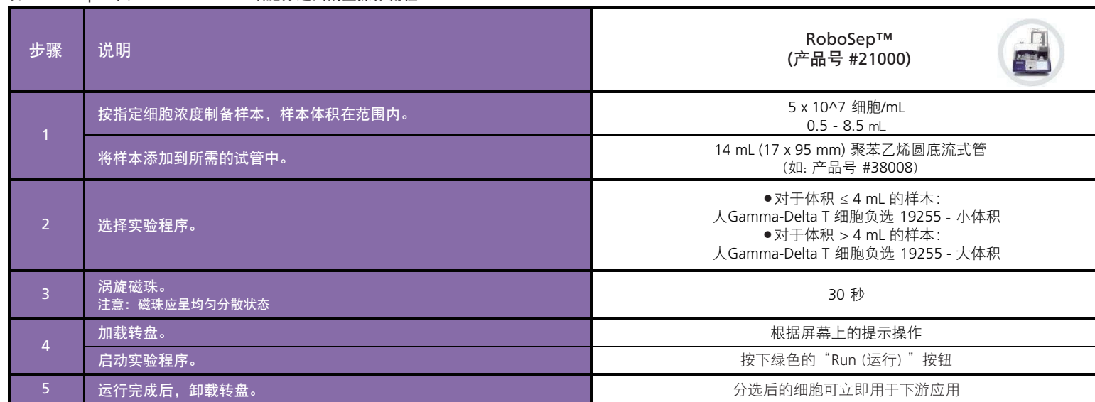
表3. RoboSep™ 人 Gamma/Delta T 细胞分选试剂盒操作流程

请参阅第1页和第2页了解样本制备和推荐缓冲液。有关RoboSep™的详细使用说明，请参阅表3。