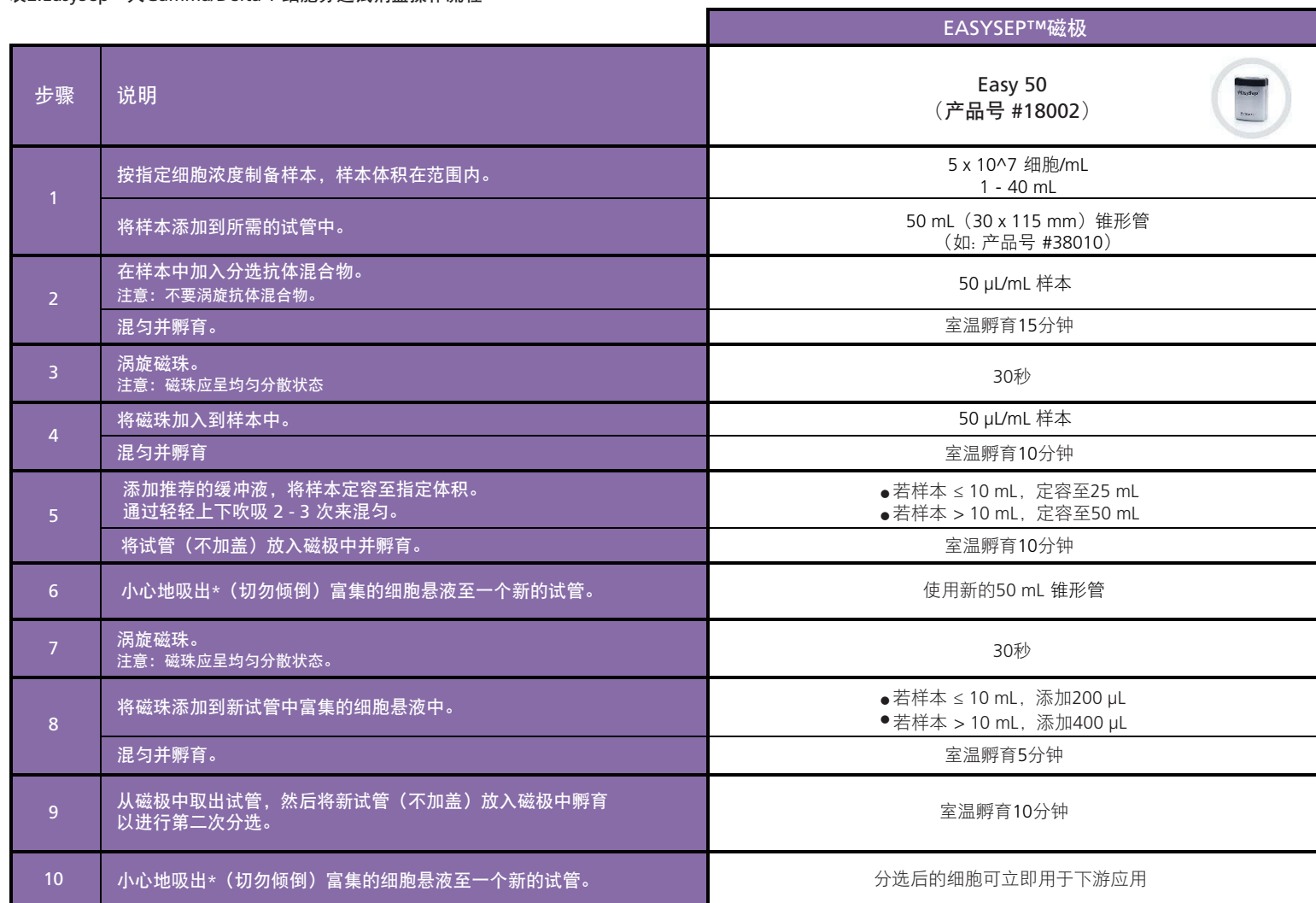
表2.EasySep™人Gamma/Delta T 细胞分选试剂盒操作流程