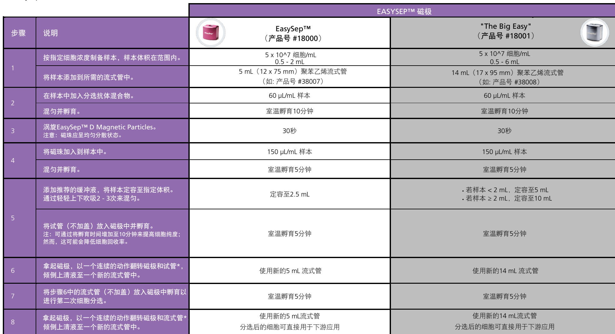
表1. EasySep™非人灵长类 CD8+ T 细胞分选试剂盒操作流程

请参阅第1页了解样本制备和推荐缓冲液。有关EasySep™的详细使用说明，请参阅表1。