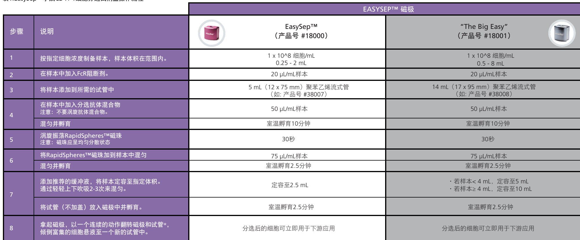
表1.EasySep™小鼠CD4+ T细胞分选试剂盒操作流程

请参阅第1页了解样本制备和推荐缓冲液。有关每种磁极的详细使用方法，请参阅表1和表2。