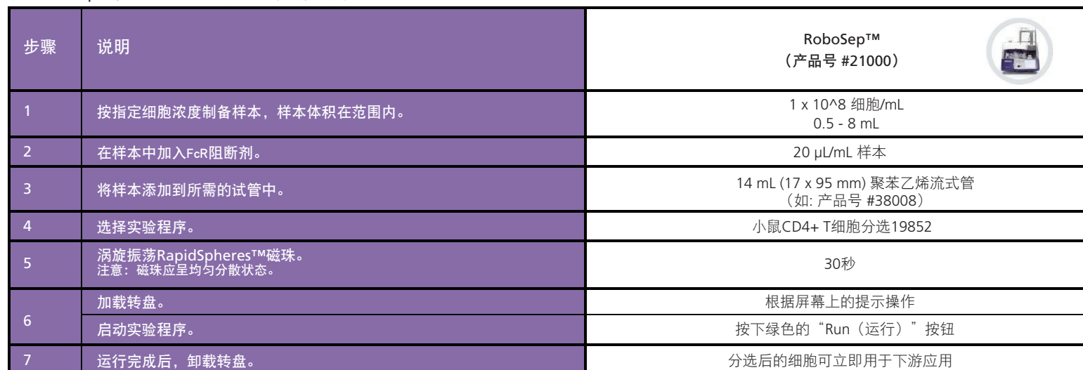
表3. RoboSep™小鼠CD4+ T细胞分选试剂盒操作流程

请参阅第1页了解样本制备和推荐缓冲液。有关RoboSep™的详细使用说明，请参阅表3。