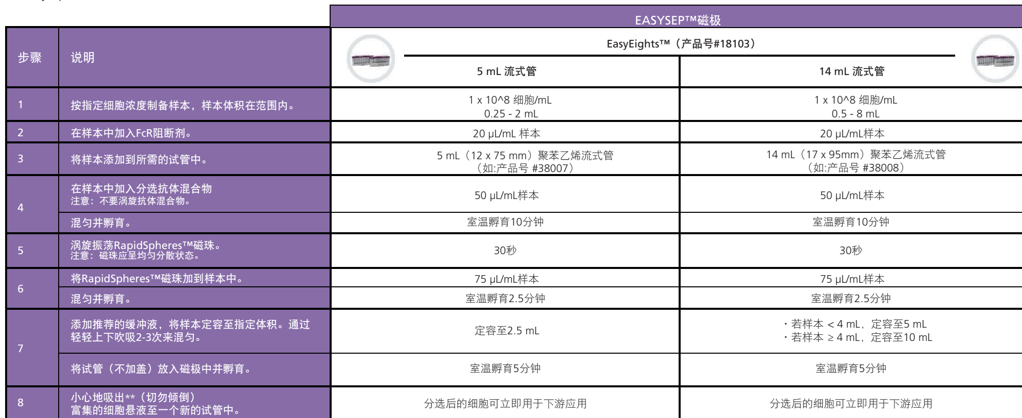
表2.EasySep™小鼠CD4+ T细胞分选试剂盒操作流程