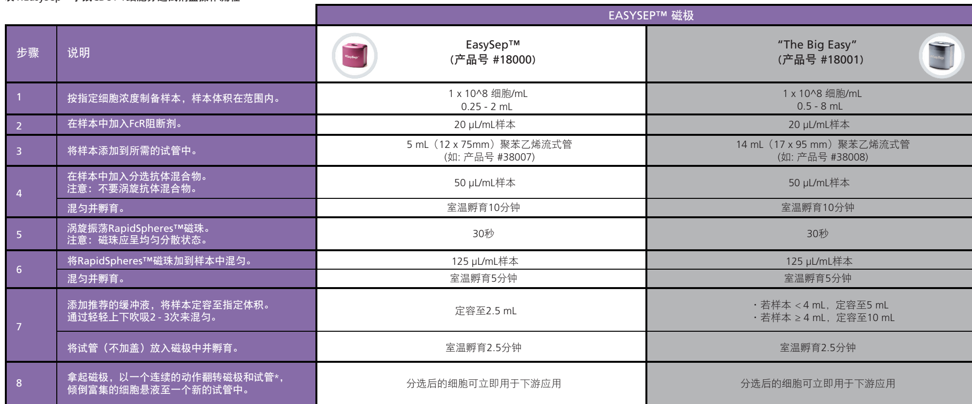
表1.EasySep™小鼠CD8+ T细胞分选试剂盒操作流程

请参阅第1页了解样本制备和推荐缓冲液。有关每种磁极的详细使用方法，请参阅表1和表2。