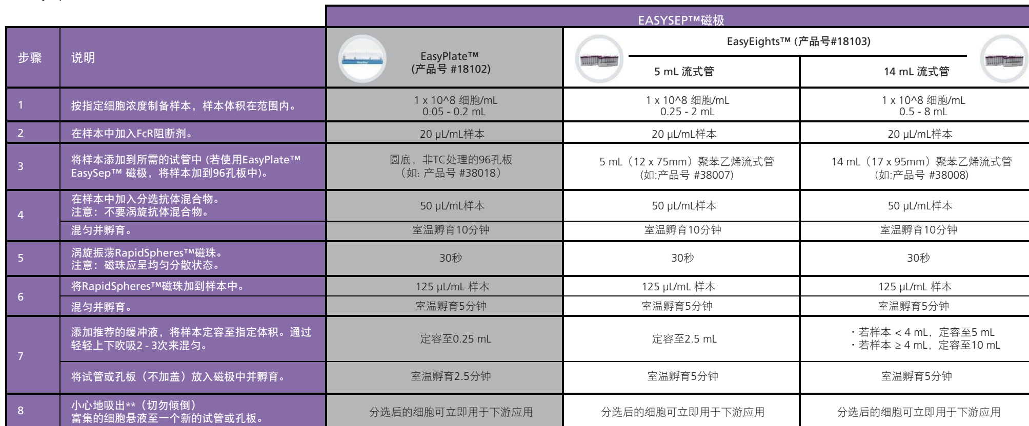
表2. EasySep™小鼠CD8+ T细胞分选试剂盒操作流程