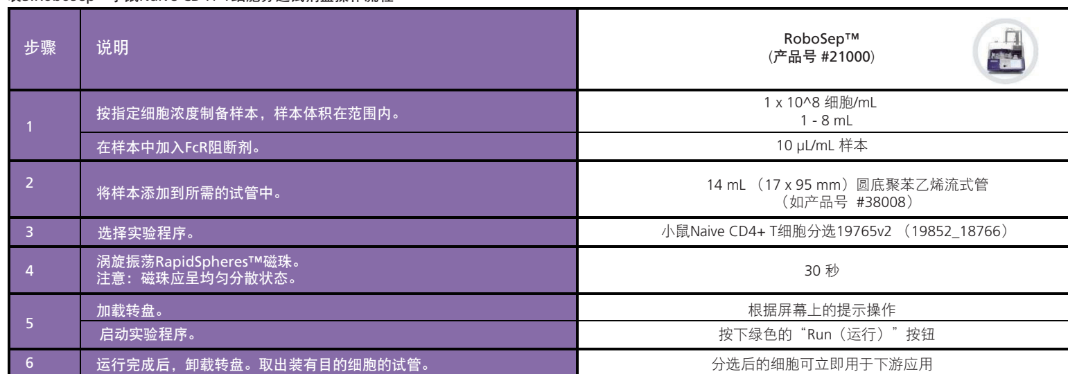
表3. RoboSep™小鼠Naïve CD4+ T细胞分选试剂盒操作流程

请参阅第1页了解样本制备和推荐缓冲液。有关RoboSep™的详细使用说明，请参阅表3。