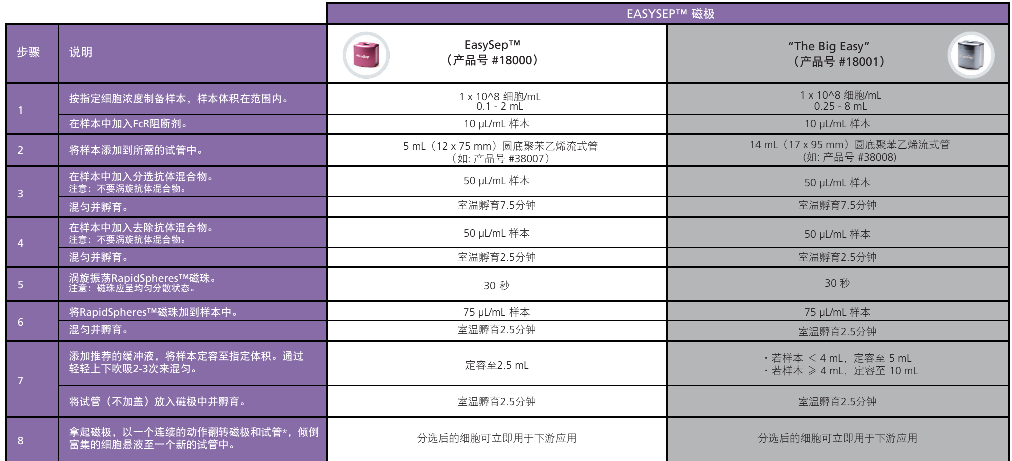
表1. EasySep™小鼠Naïve CD4+ T细胞分选试剂盒操作流程

请参阅第1页了解样本制备和推荐缓冲液。有关每种磁极的详细使用方法，请参阅表1和表2。