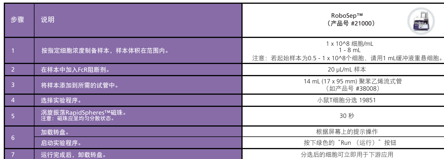
表3. RoboSep™小鼠T细胞分选试剂盒操作流程

请参阅第1页了解样本制备和推荐缓冲液。有关RoboSep™的详细使用说明，请参阅表3。