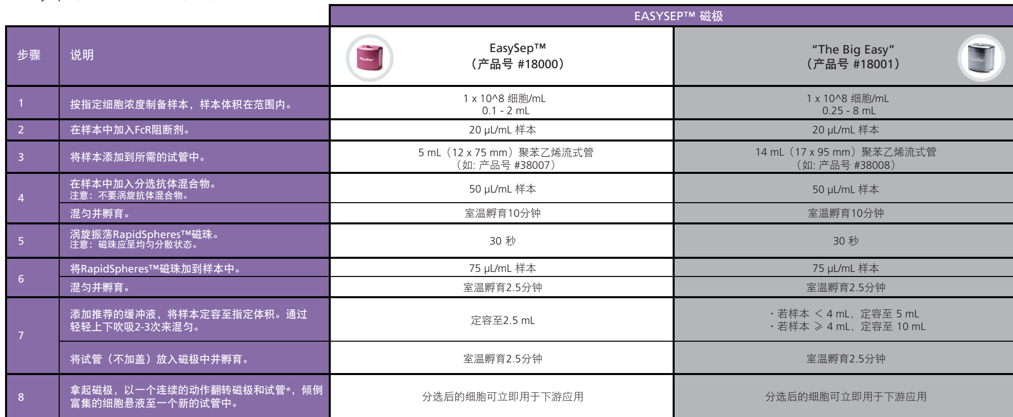
表1. EasySep™小鼠T细胞分选试剂盒操作流程

请参阅第1页了解样本制备和推荐缓冲液。有关每种磁极的详细使用方法，请参阅表1和表2。