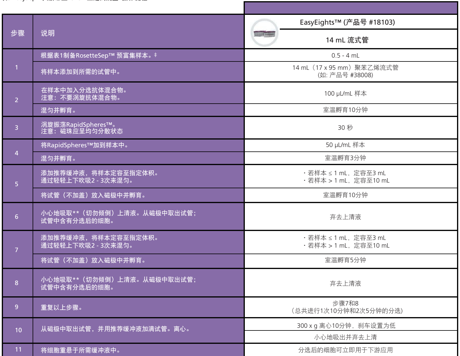
表3.EasySep™人脐带血 CD34 正选试剂盒II操作流程