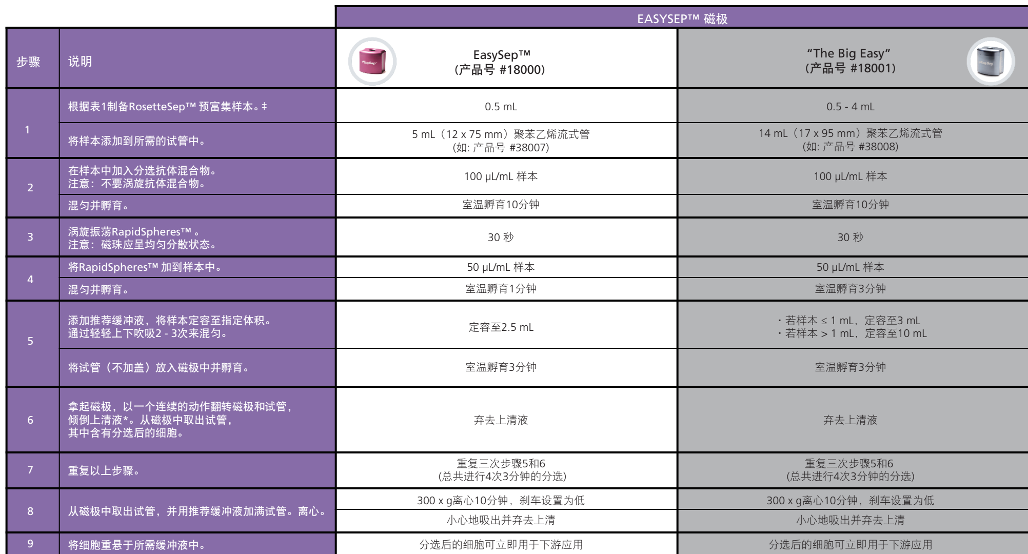
表2.EasySep™人脐带血 CD34 正选试剂盒II操作流程