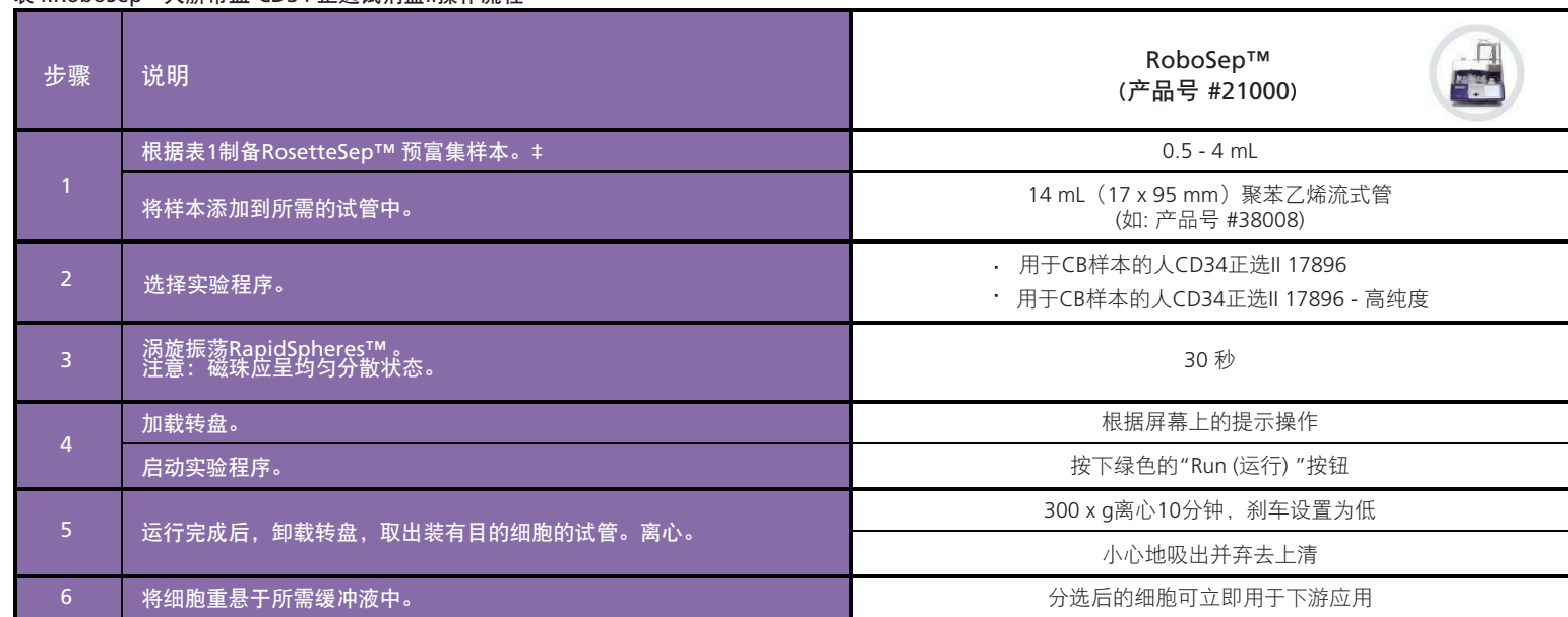
表4. RoboSep™人脐带血 CD34 正选试剂盒II操作流程

‡ 可将多管脐血样本中得到的细胞沉淀先根据表1第10步重悬，然后合并处理，合并后最大体积为4 mL。