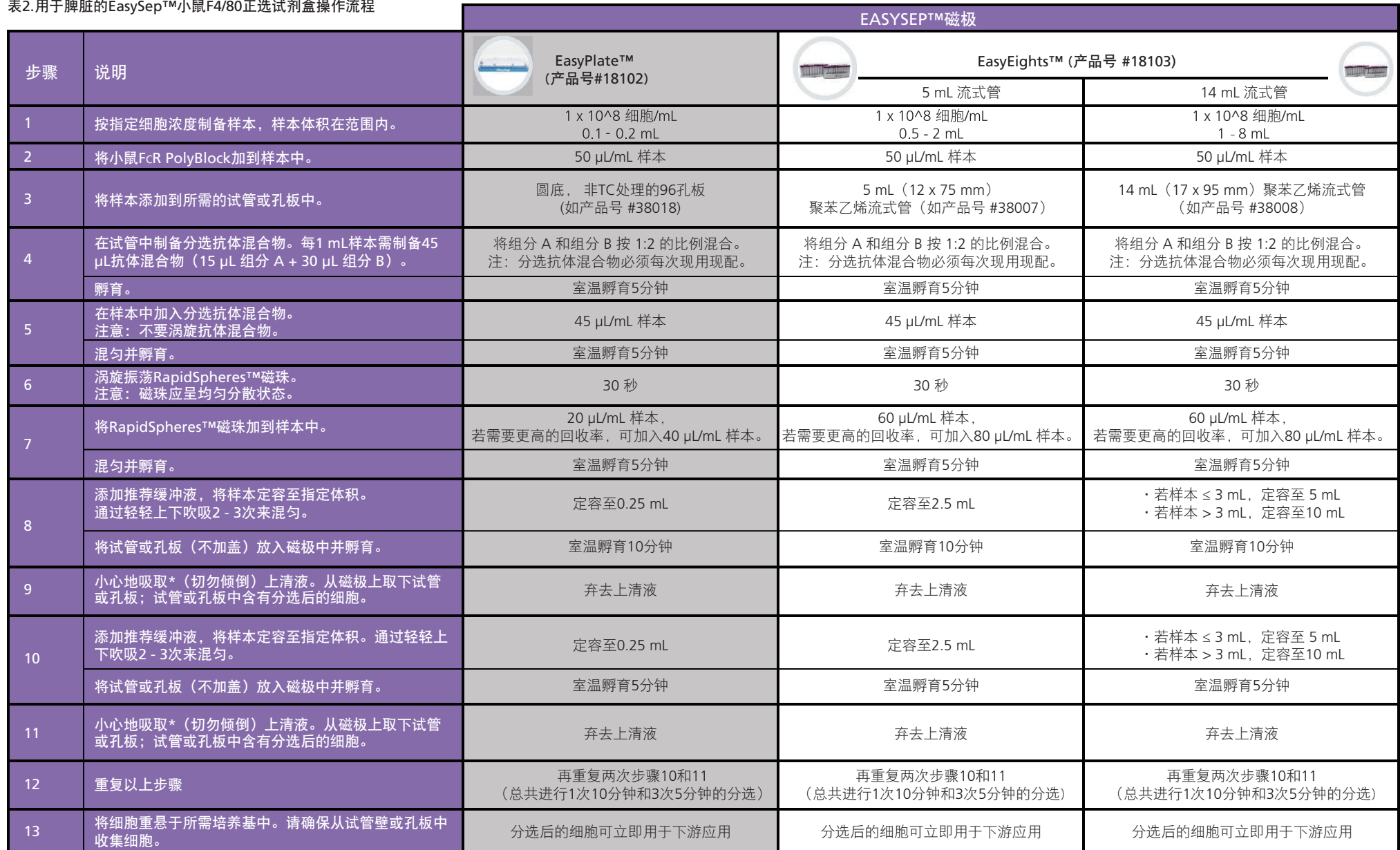
表2.用于脾脏的EasySep™小鼠F4/80正选试剂盒操作流程