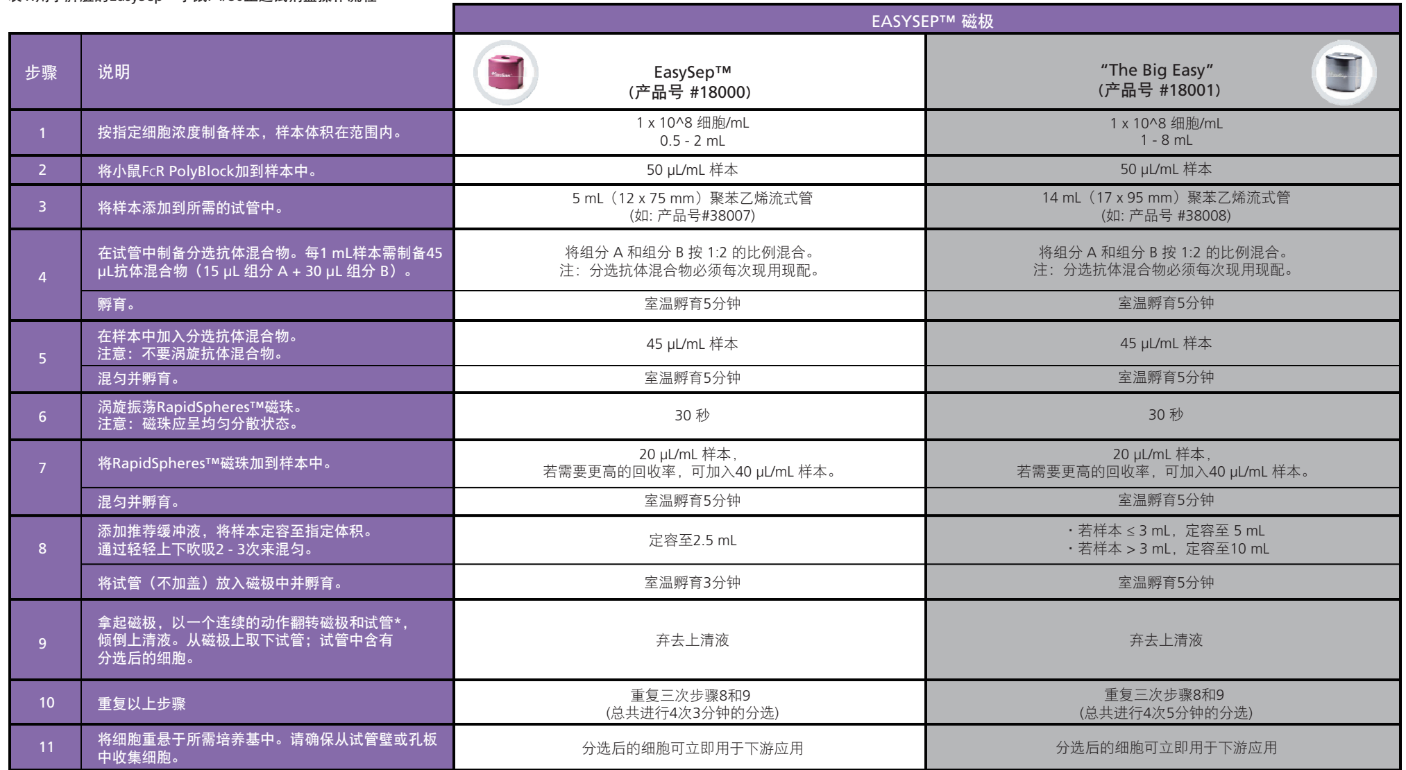
表1.用于脾脏的EasySep™小鼠F4/80正选试剂盒操作流程

请参阅第2页了解样本制备和推荐缓冲液。有关每种磁极的详细使用方法，请参阅表1和表2。