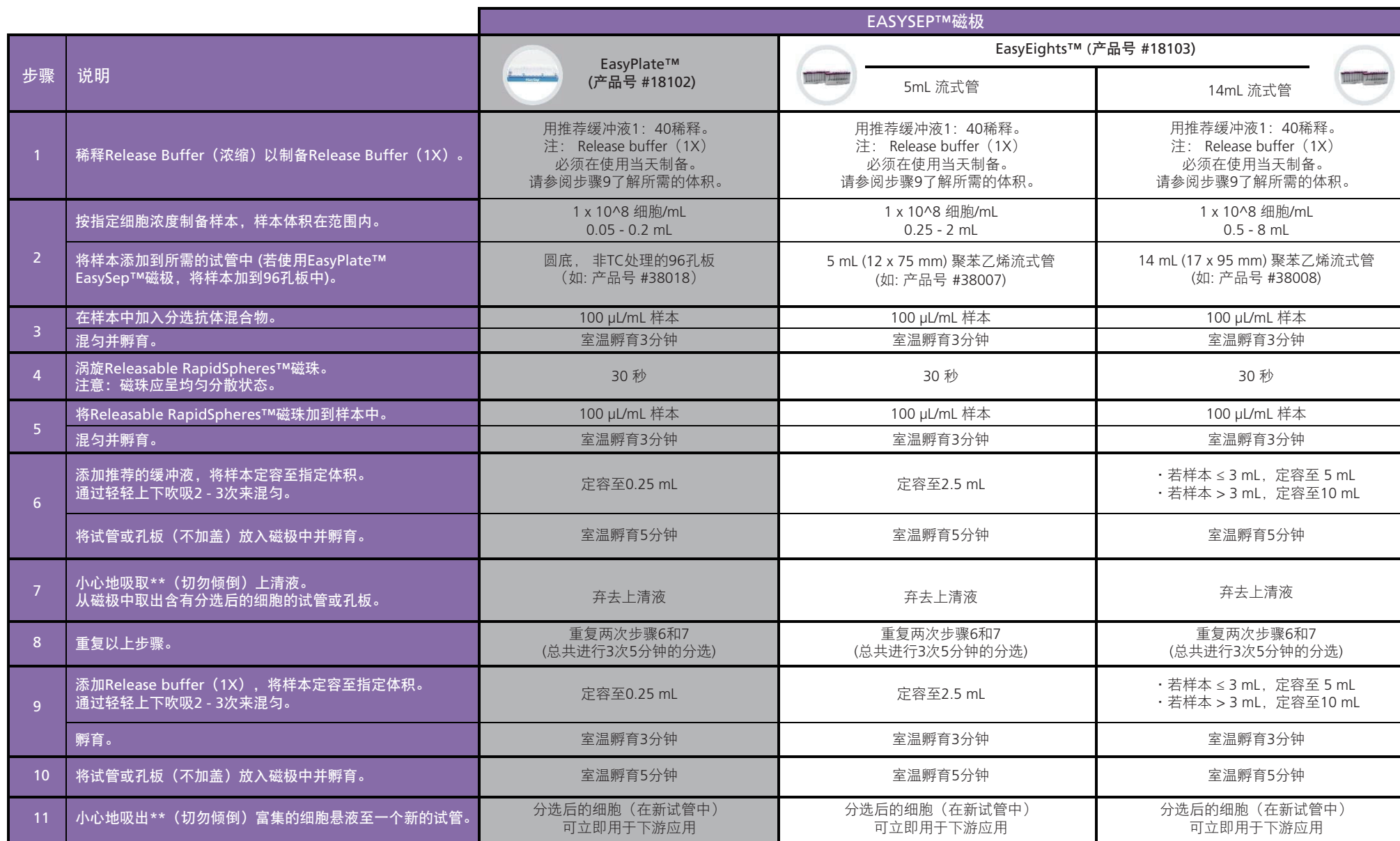
表2. EasySep™ Release 人 CD3 正选试剂盒操作流程