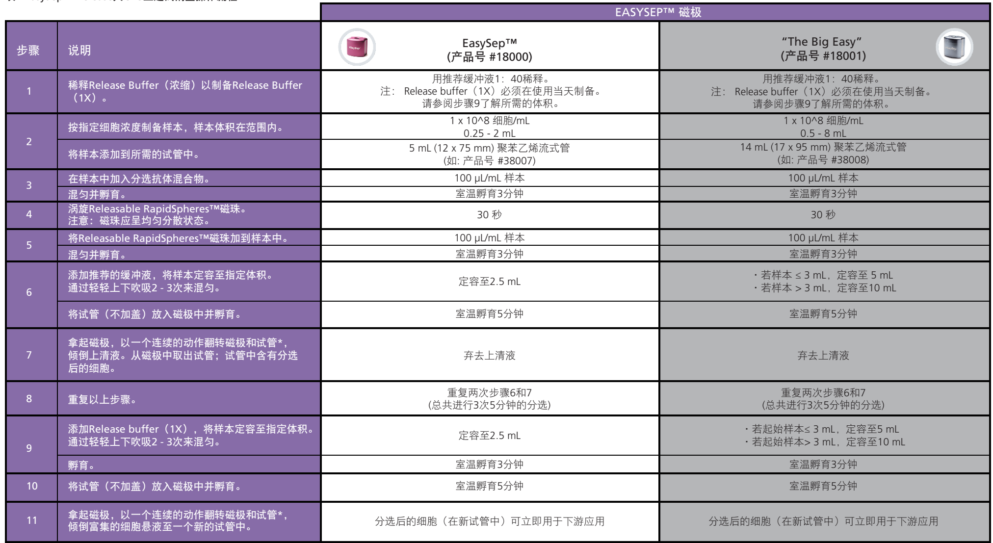
表1. EasySep™ Release人CD3正选试剂盒操作流程

请参阅第1页了解样本制备和推荐缓冲液。有关每种磁极的详细使用方法，请参阅表1和表2。