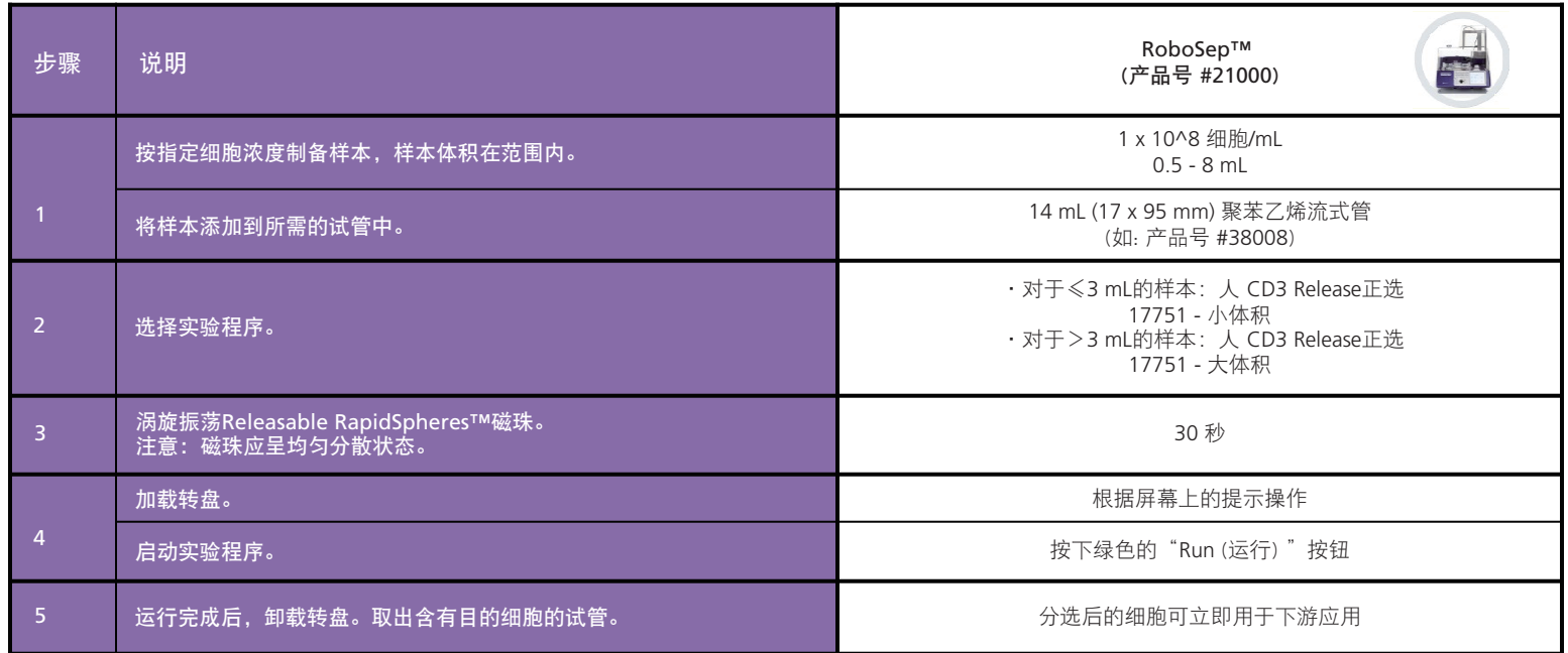
表3. RoboSep™ Release人CD3正选试剂盒操作流程

请参阅第1页了解样本制备和推荐缓冲液。有关RoboSep™的详细使用说明，请参阅表3。