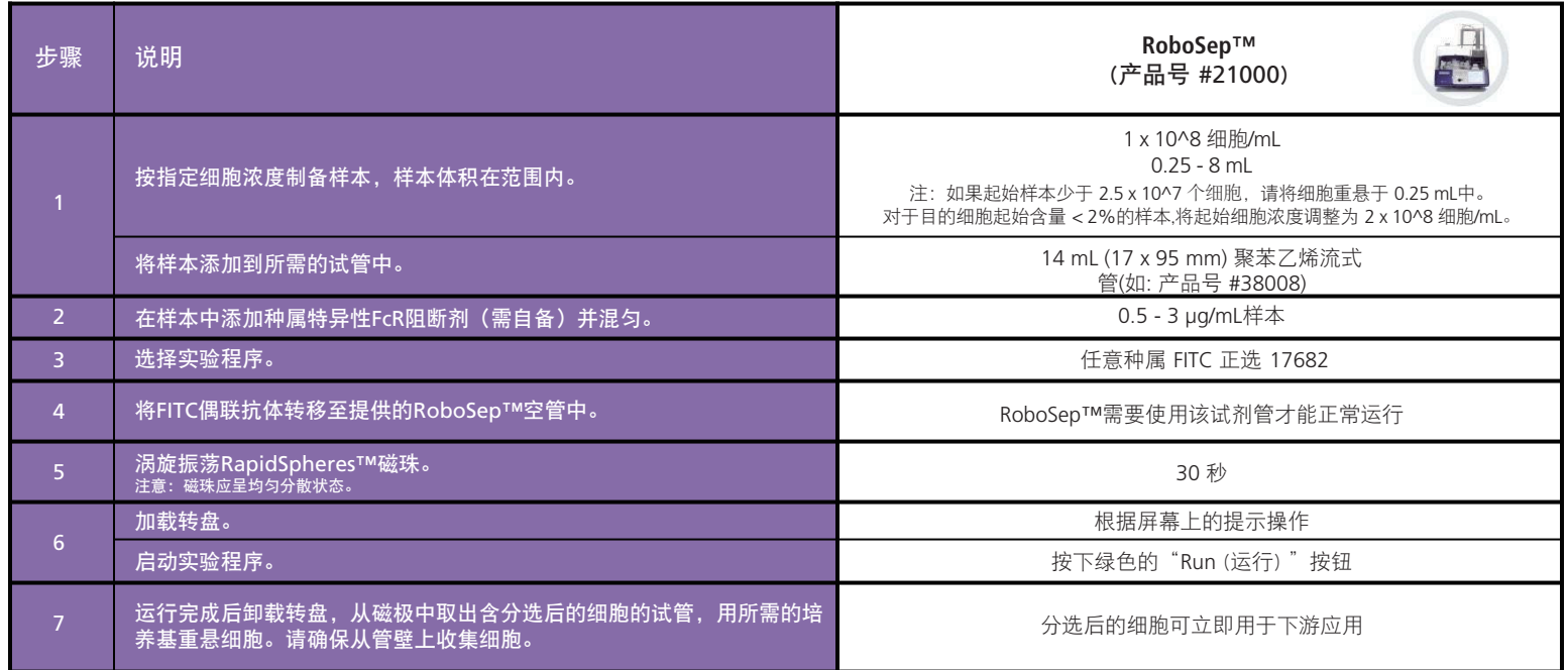
表3. RoboSep™ FITC 正选试剂盒II 操作流程

请参阅第 1 页了解样本制备和推荐缓冲液。有关RoboSep™的详细使用说明，请参阅表3。