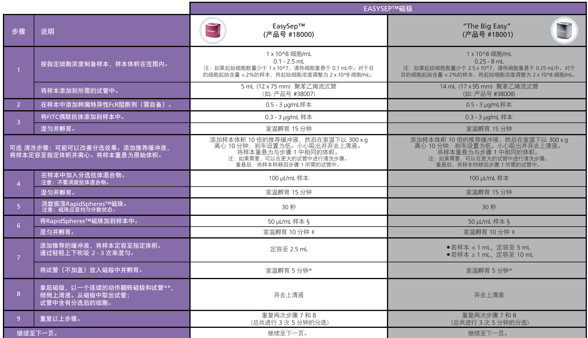
表 1. EasySep™ FITC 正选试剂盒II 操作流程

请参阅第 1 页了解样本制备和推荐缓冲液。有关每种磁极的详细信息，请参阅表 1 和表 2。