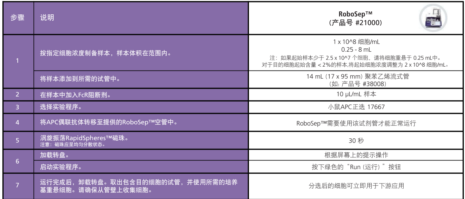
表3. RoboSep™小鼠 APC 正选试剂盒II操作流程

请参阅第1页了解样本制备和推荐缓冲液。有关RoboSep™的详细使用说明，请参阅表3。