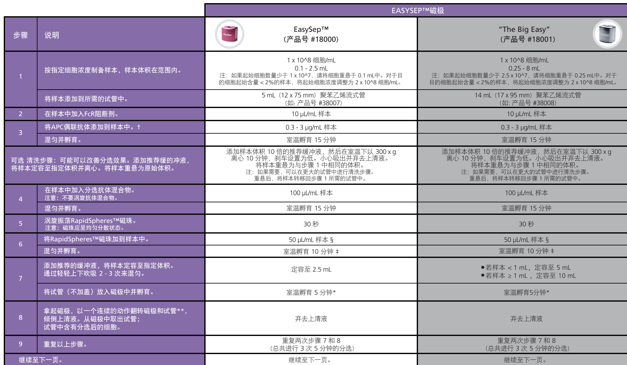
表1. EasySep™小鼠 APC 正选试剂盒II操作流程

请参阅第1页了解样本制备和推荐缓冲液。有关每种磁极的详细使用方法，请参阅表1和表2。