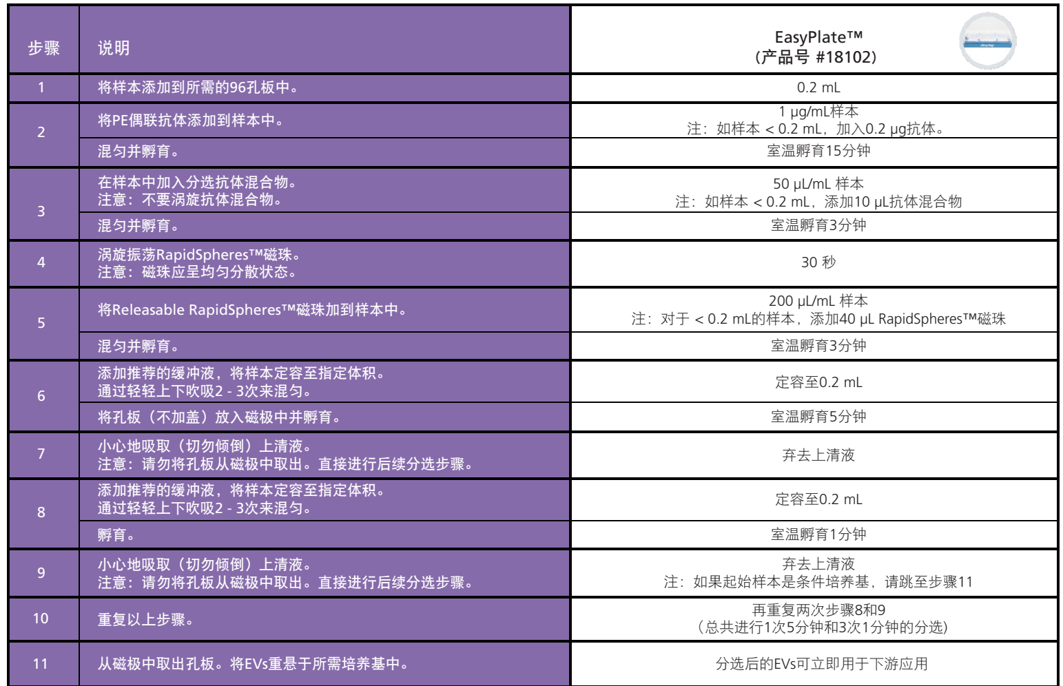
表2. EasySep™细胞外囊泡PE正选试剂盒操作流程