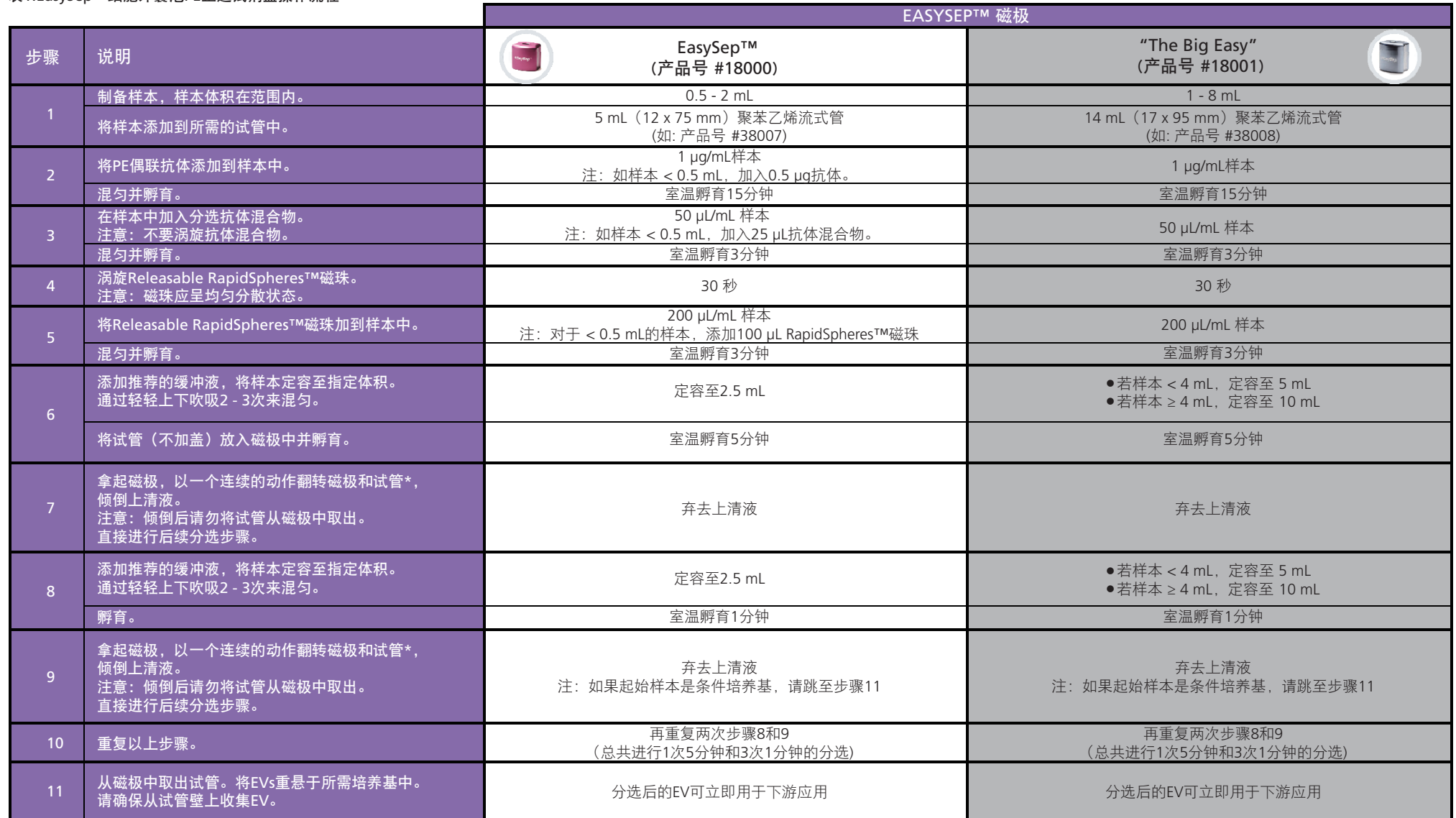
表1. EasySep™细胞外囊泡PE正选试剂盒操作流程

请参阅第1页和第2页了解样本制备和推荐缓冲液。有关每种磁极的详细信息，请参阅表1至表2。