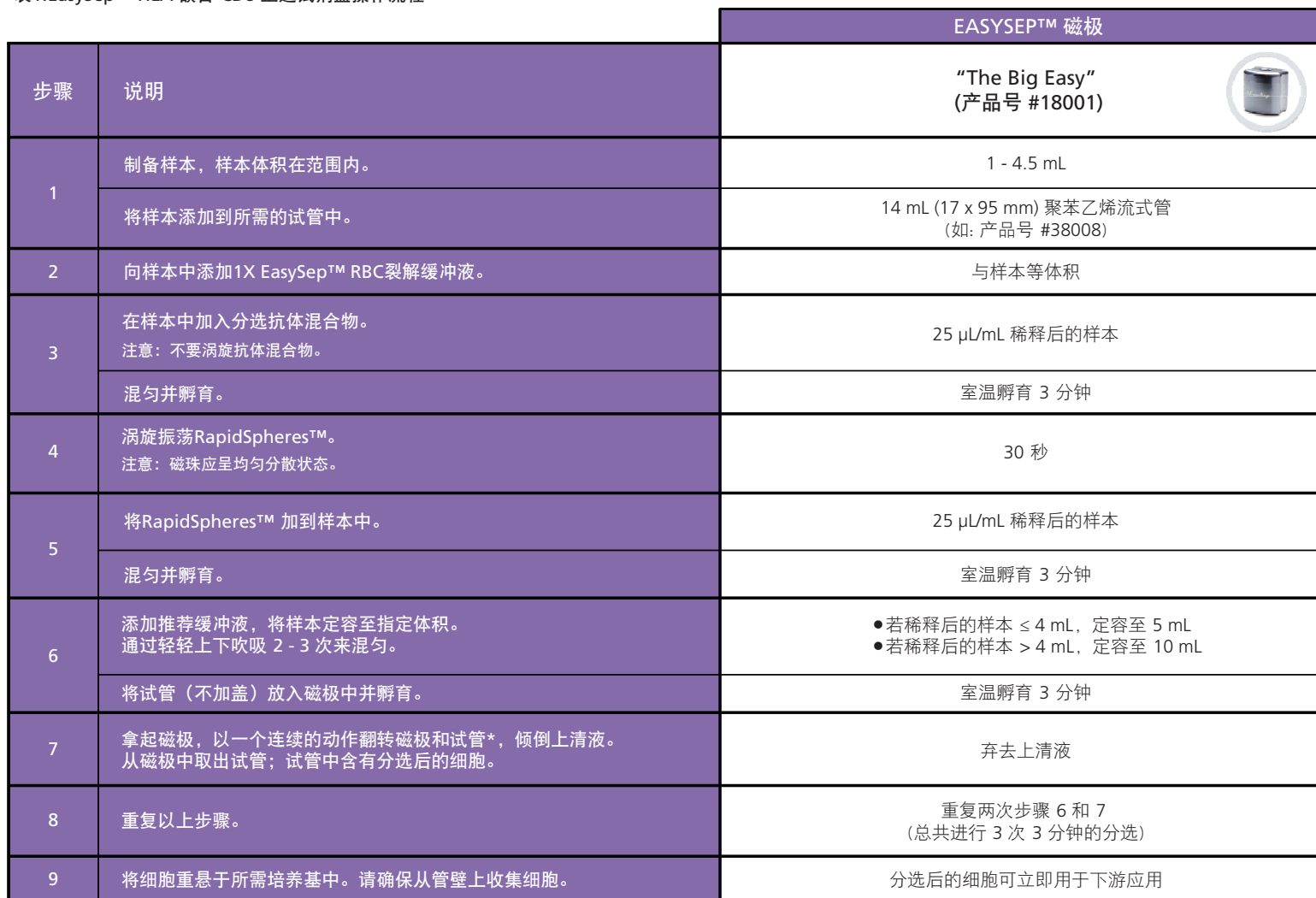
表1.EasySep™ HLA 嵌合 CD8 正选试剂盒操作流程

请参阅第 1 页了解样本制备和推荐缓冲液。有关EasySep™的详细使用说明，请参阅表 1 和表 2。