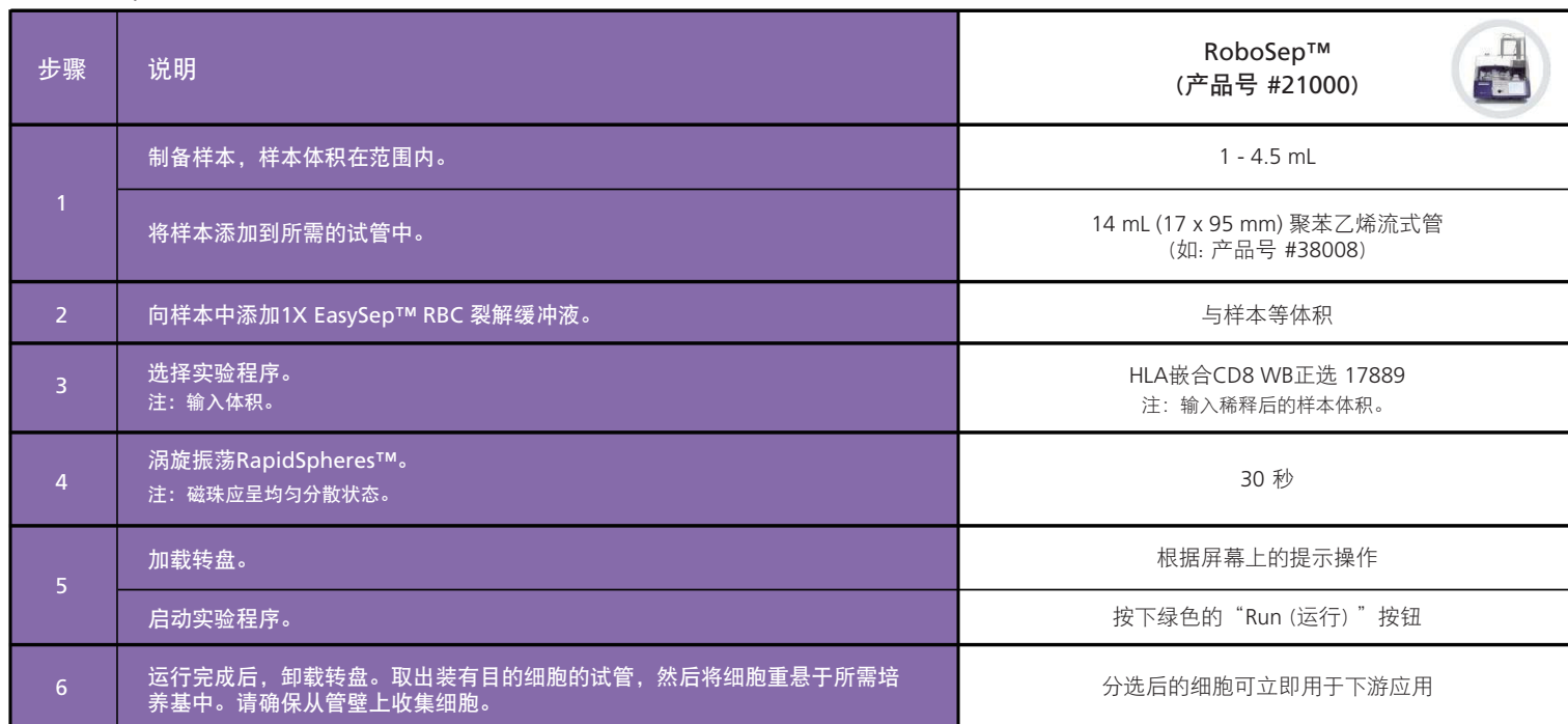
表3. RoboSep™ HLA 嵌合 CD8 正选试剂盒操作流程

请参阅第 1 页了解样本制备和推荐缓冲液。有关RoboSep™的详细使用说明，请参阅表 3。