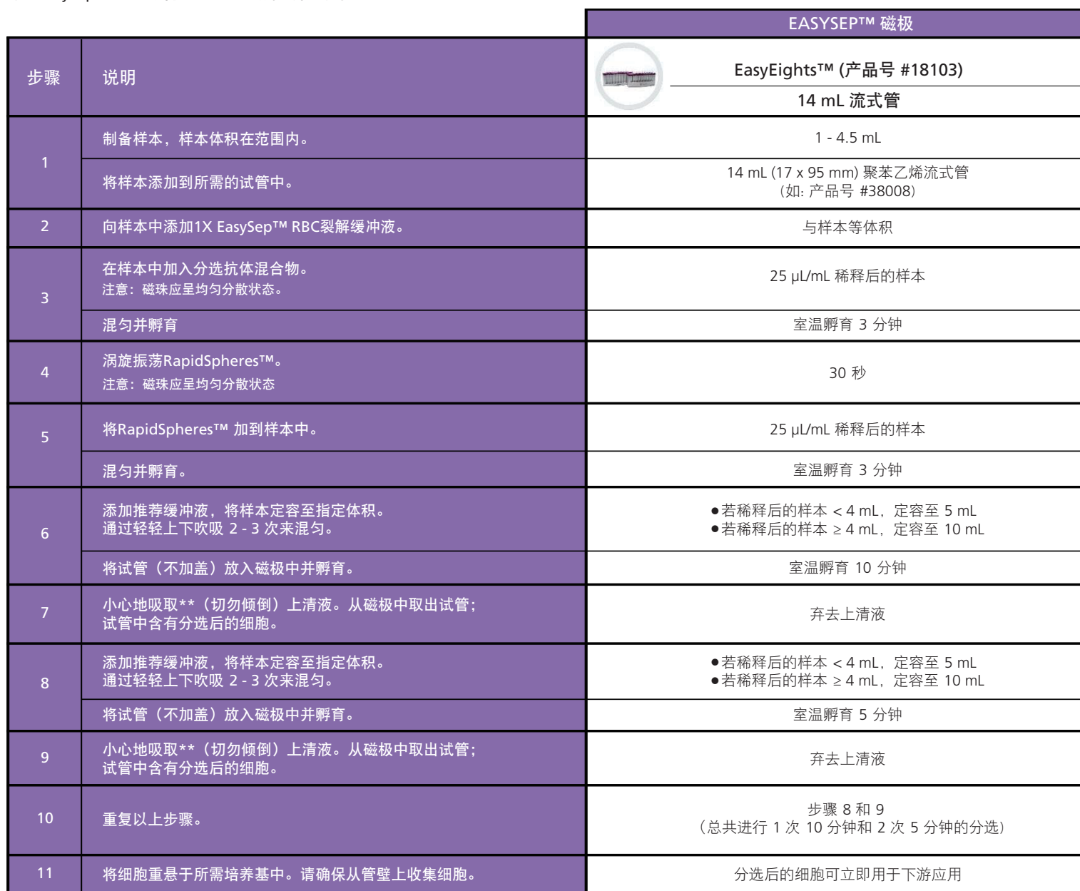
表2. EasySep™ HLA 嵌合 CD8 正选试剂盒操作流程