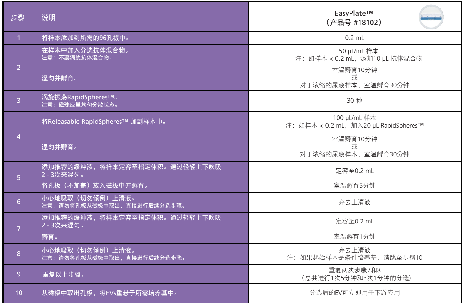
表2. EasySep™人总细胞外囊泡正选试剂盒操作流程