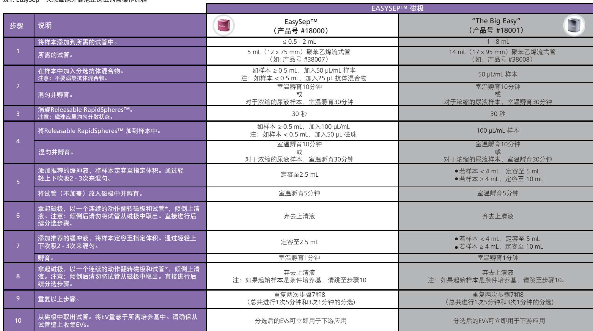
表1. EasySep™人总细胞外囊泡正选试剂盒操作流程

请参阅第1页和第2页了解样本制备和推荐缓冲液。有关每种磁极的详细使用方法，请参阅表1和表2。