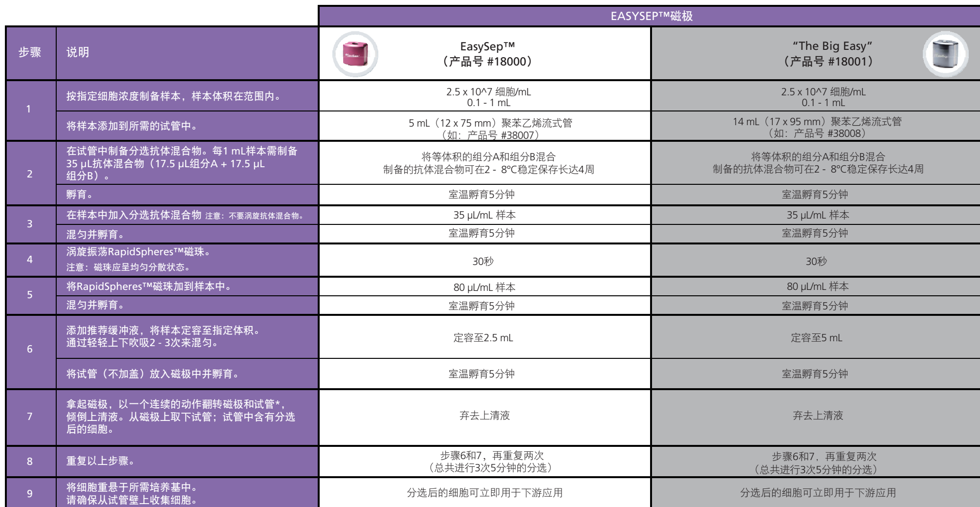
表1.用于脑组织的EasySep™小鼠 CD11b 正选试剂盒II操作流程

请参阅第2页了解样本制备和推荐缓冲液。有关每种磁极的详细使用方法，请参阅表1和表2。