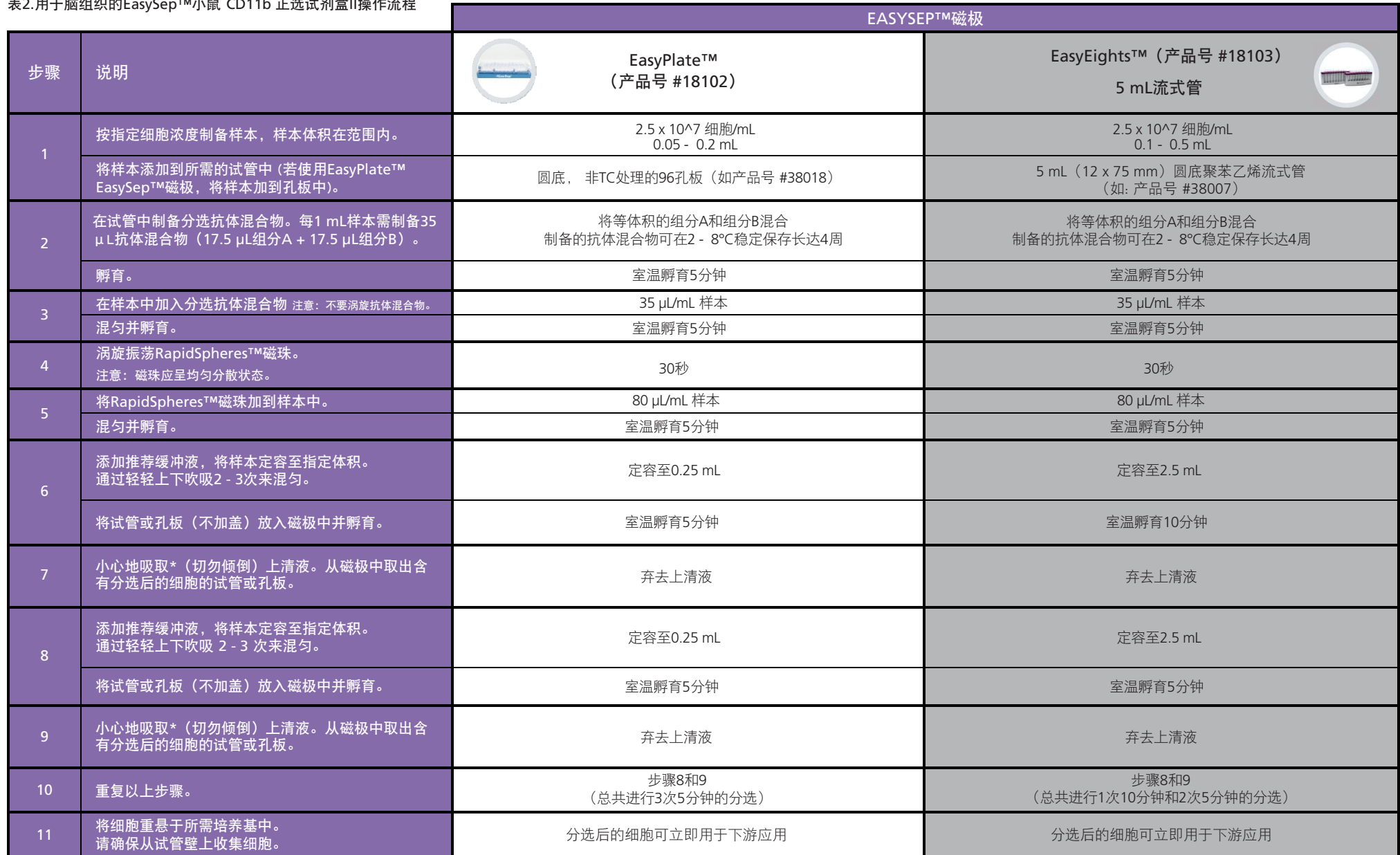
表2.用于脑组织的EasySep™小鼠 CD11b 正选试剂盒II操作流程