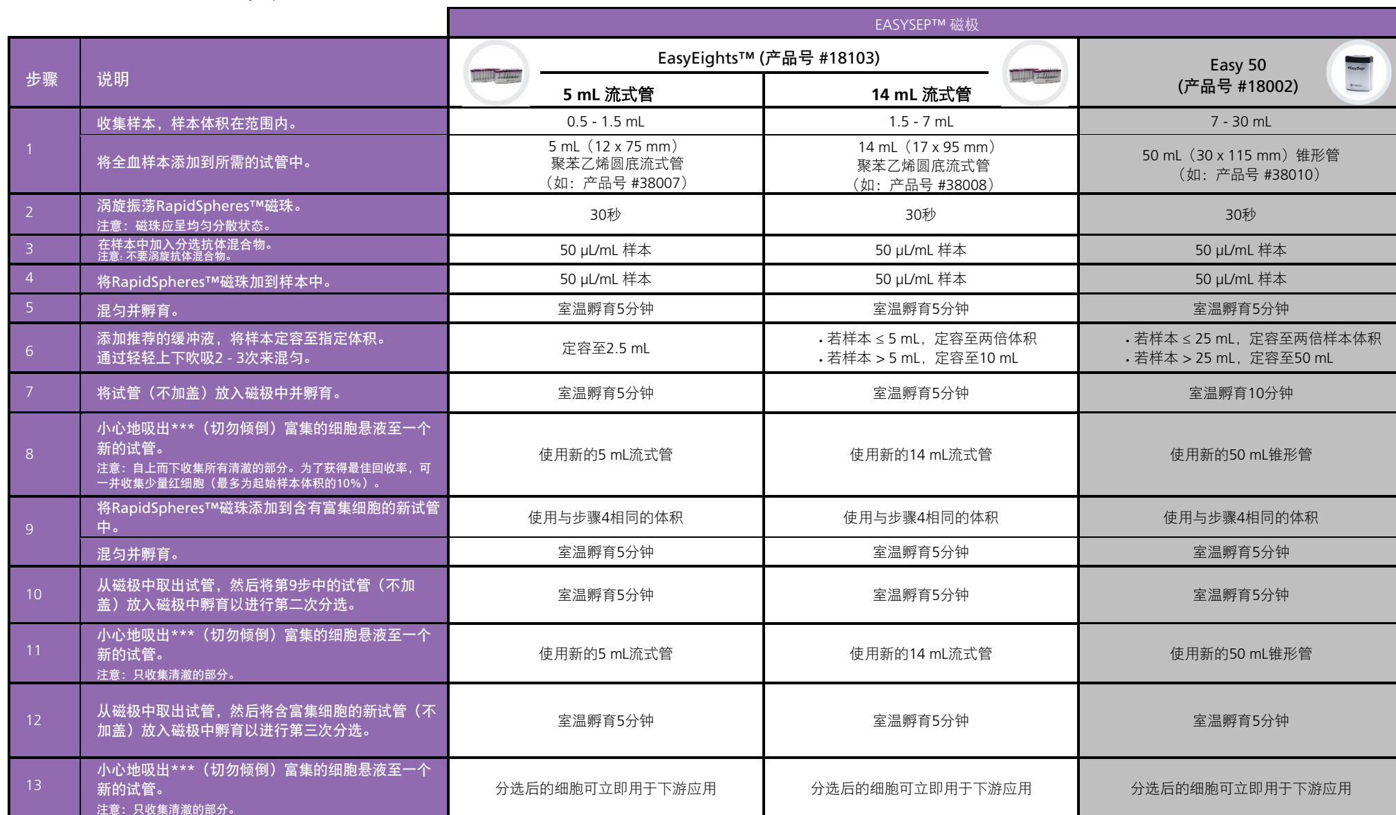
表2.适用于全血、白膜层或脾脏的EasySep™ Direct人总淋巴细胞分选试剂盒操作流程