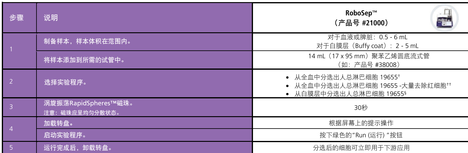
表3.适用于全血、白膜层或脾脏的RoboSep™ Direct人总淋巴细胞分选试剂盒操作流程

† 如果样本是脾脏，请使用此实验程序。†† 该方案能使红细胞大量减少，但是回收率会降低。§ 该方案会用两次EasySep™ 试剂。