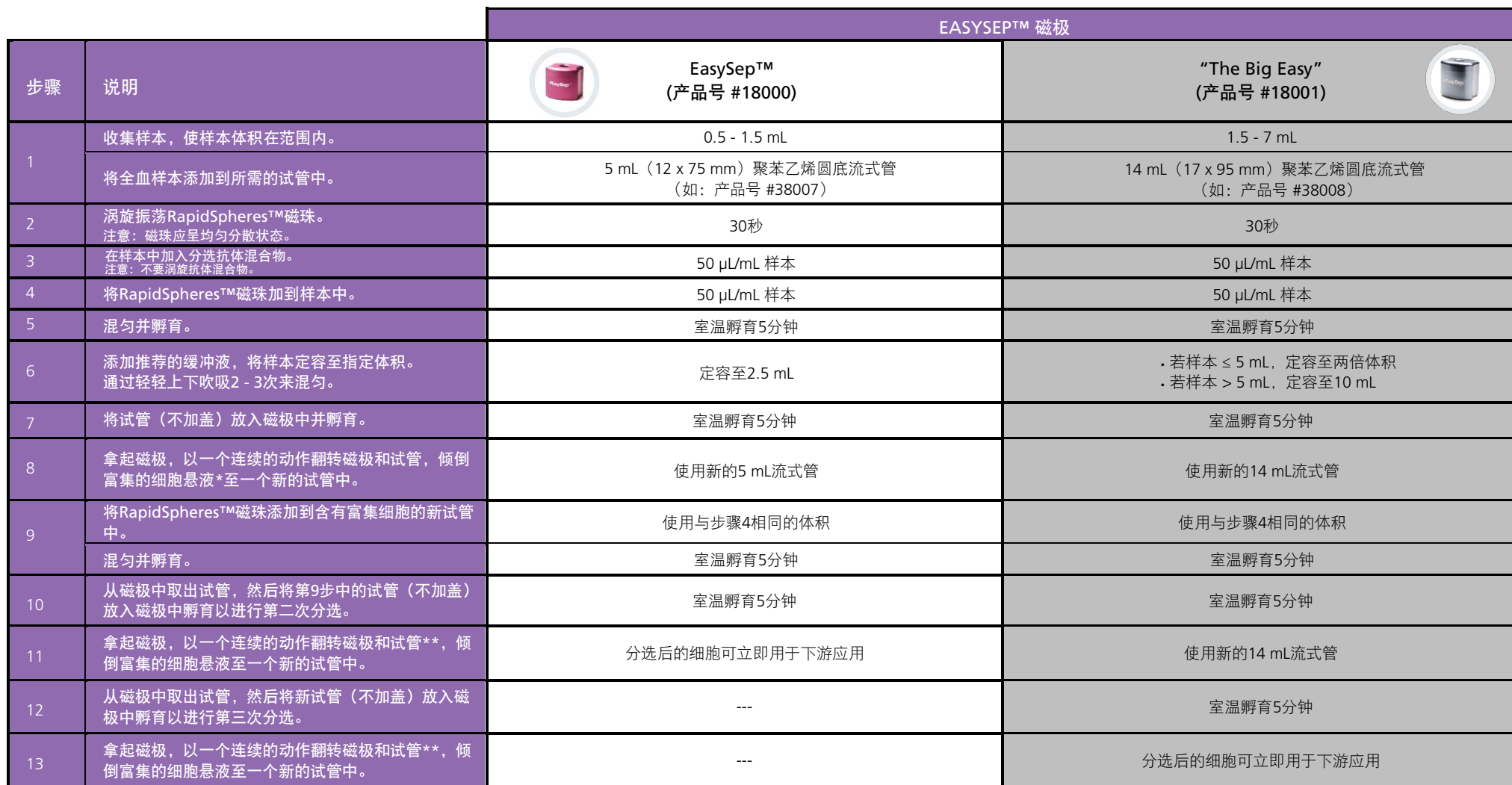
表1.适用于全血、白膜层或脾脏的EasySep™ Direct人总淋巴细胞分选试剂盒操作流程

请参阅第1页了解样本制备和推荐缓冲液。有关每种磁极的详细使用方法，请参阅表1和表2。