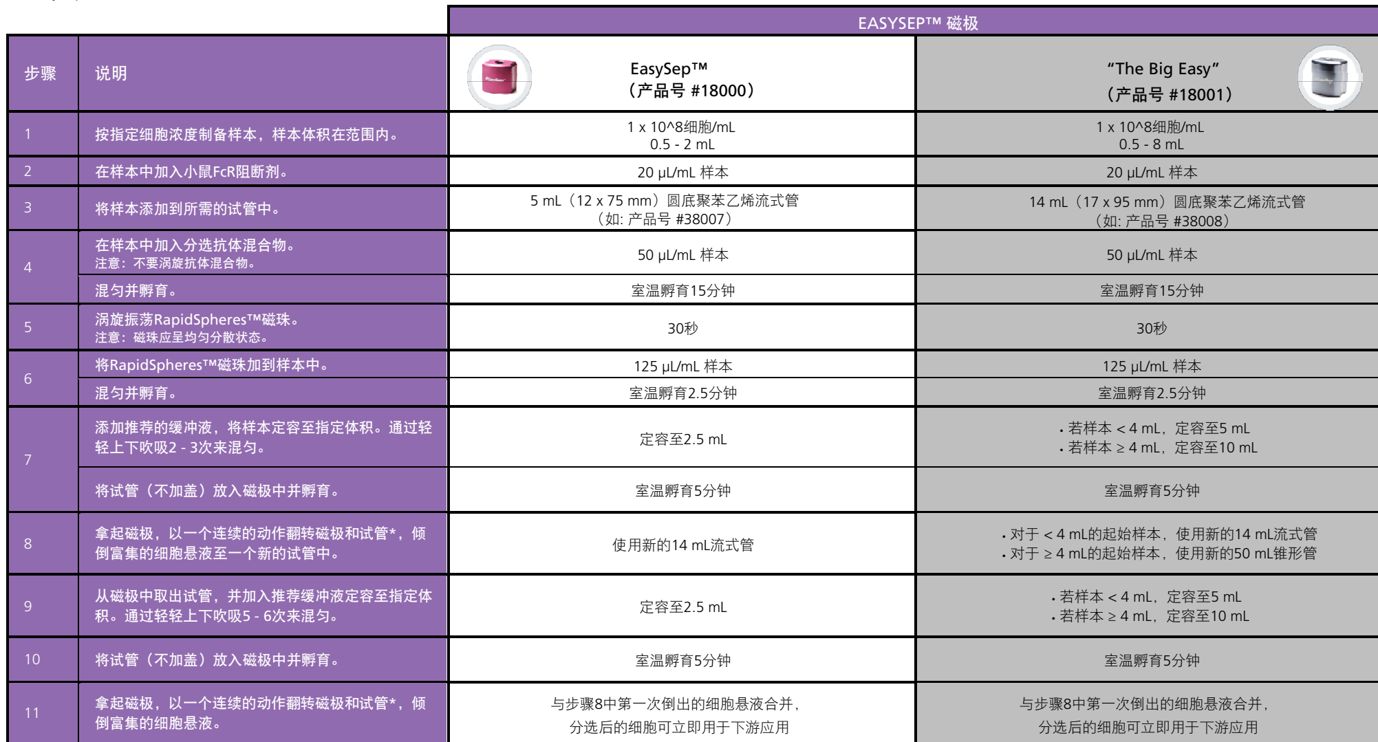
表1.EasySep™ 小鼠记忆CD4+ T细胞分选试剂盒操作流程

请参阅第1页了解样本制备和推荐缓冲液。有关每种磁极的详细使用方法，请参阅表1和表2。