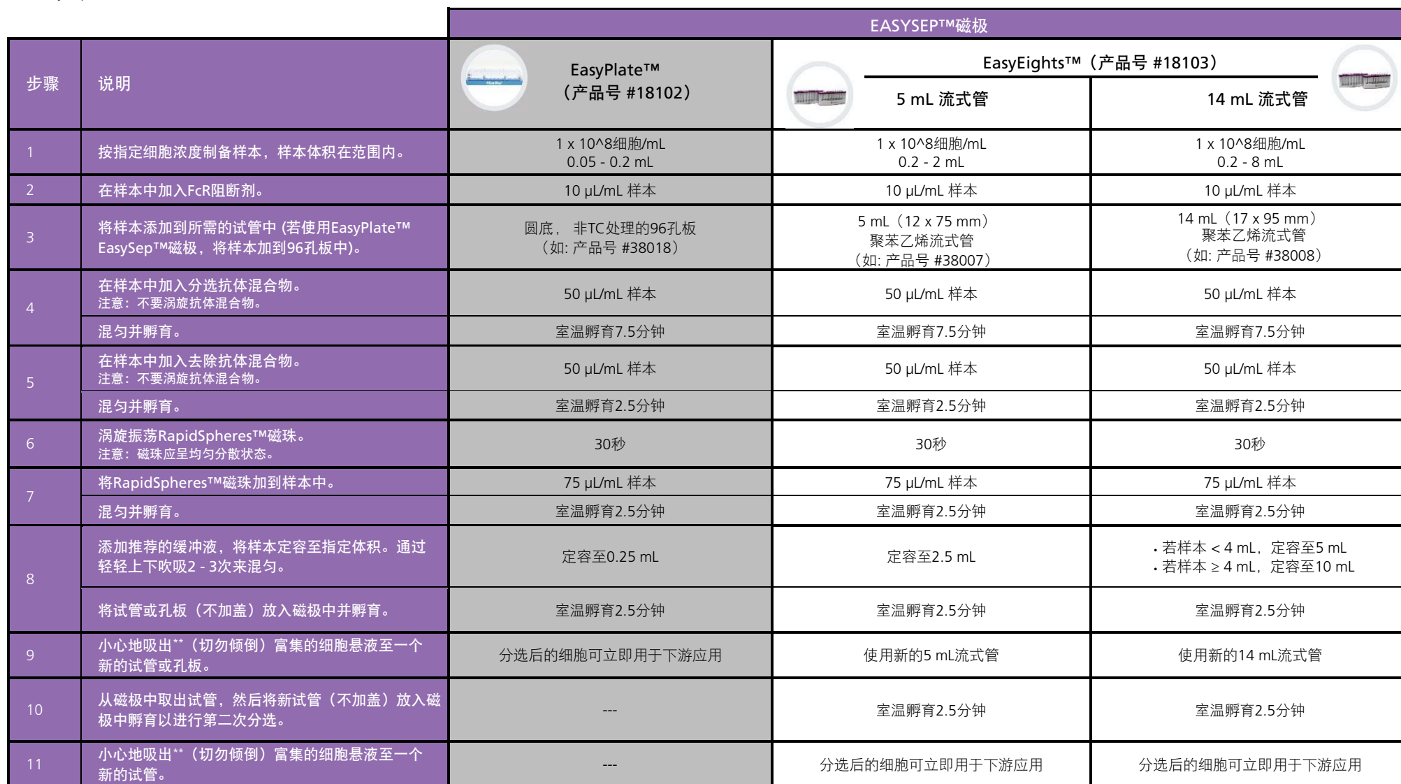
表2.EasySep™ 小鼠Pan-Naïve T细胞分选试剂盒操作流程