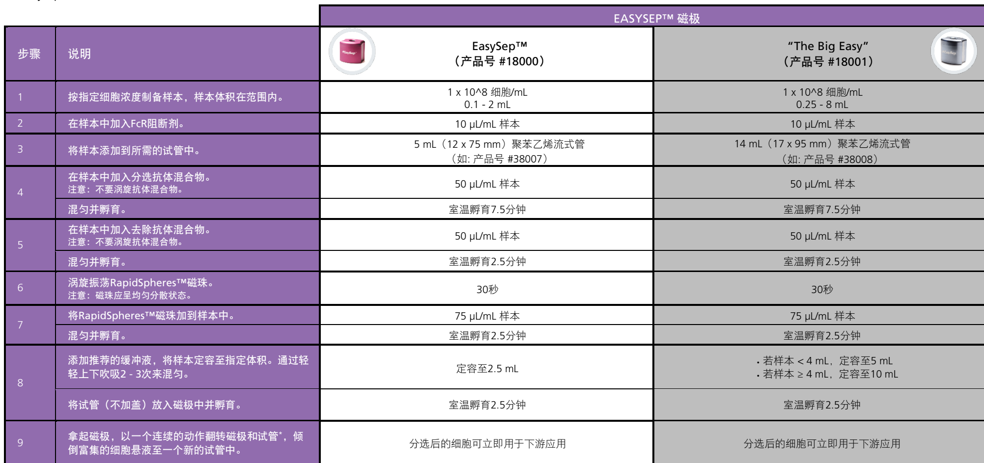
表1. EasySep™ 小鼠Pan-Naïve T细胞分选试剂盒操作流程

请参阅第1页了解样本制备和推荐缓冲液。有关每种磁极的详细使用方法，请参阅表1和表2。