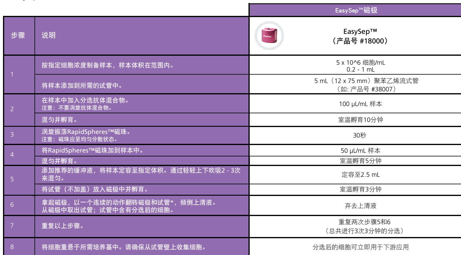
表1.EasySep™人 CD56 正选试剂盒II操作流程