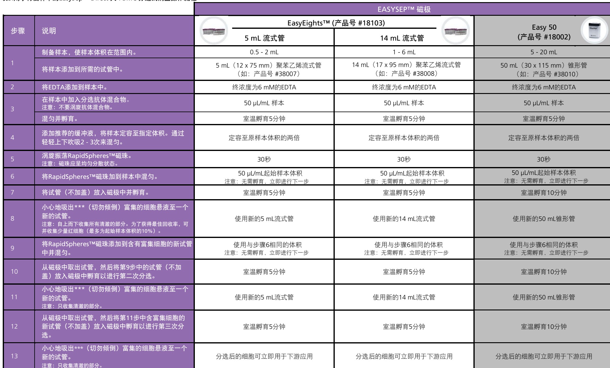
表3.用于骨髓样本的EasySep™ Direct 人 PBMC 分选试剂盒操作流程