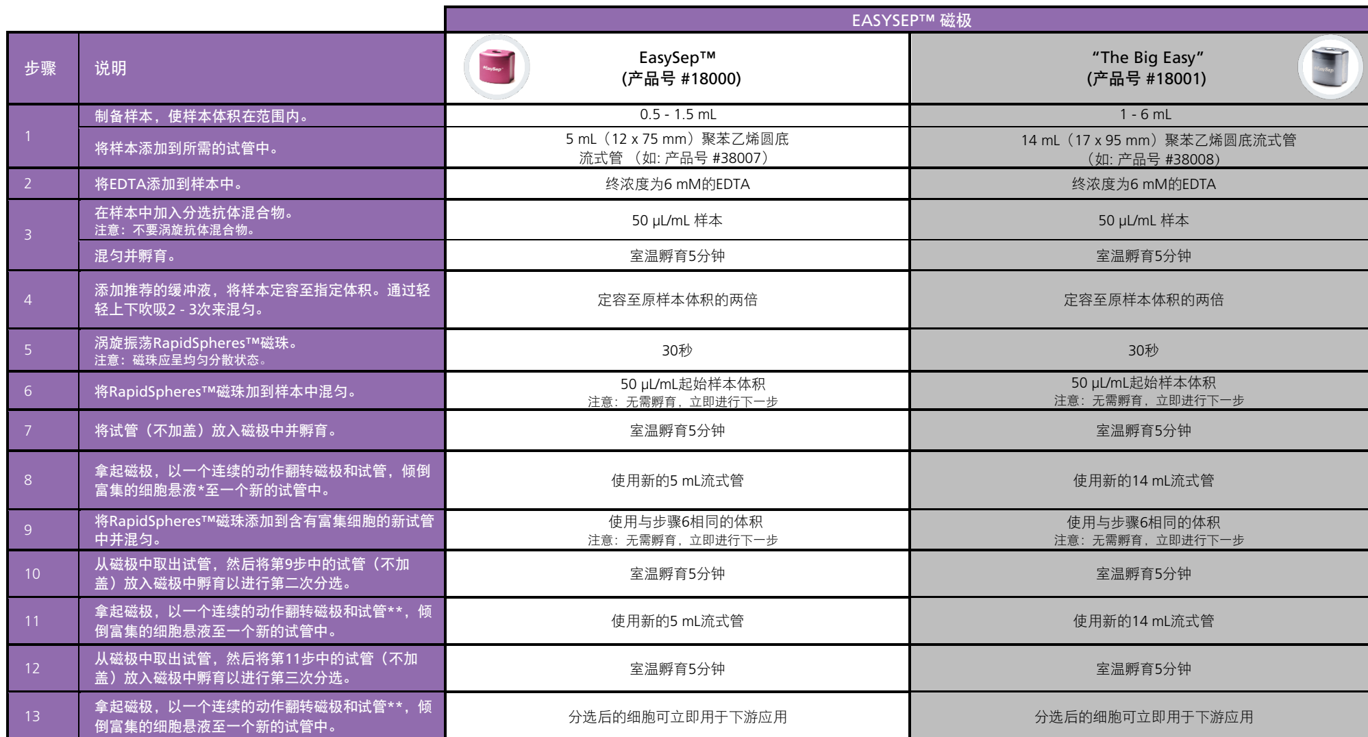
表2.用于骨髓样本的EasySep™ Direct 人 PBMC 分选试剂盒操作流程

请参阅第1页了解样本制备和推荐缓冲液。有关每种磁极的详细使用方法，请参阅表2和表3。